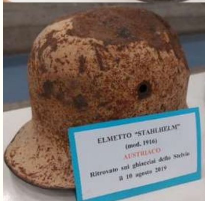
ELMETTO "STAHLHELM" (mod. 1916) AUSTRIACO Ritrovato sui ghiacciai dello Stocvio il 10 agosto 2019