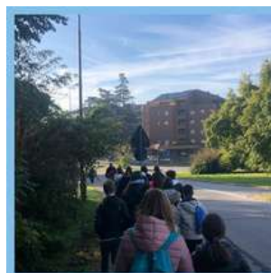
In marcia verso la Medateca

All'arrivo, siamo stati accolti da un attore che ha dato vita a storie straordinarie leggendo ad alta voce. I suoi racconti spaziavano da storie horror a gialli avvincenti, fino a storie di fantasia. È stato come assistere a un film dal vivo, con i personaggi che prendevano forma grazie all'abilità dell'attore.