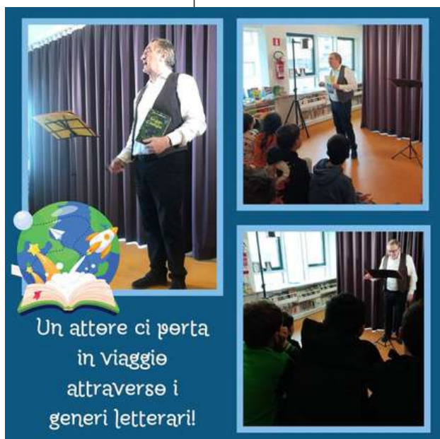
Un attore ci porta in viaggio attraverso i generi letterari!

Un momento che ci ha colpito profondamente è stato quando l'attore ha presentato i gialli. Ci siamo sentiti come protagonisti di un'indagine, completamente rapiti dalla narrazione. Ogni colpo di scena faceva vibrare i nostri cuori, facendoci rendere conto di quanto la lettura possa evocare emozioni forti.