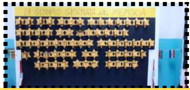
I lavori degli studenti della scuola secondaria "A. Frank", in occasione della Giornata della Memoria