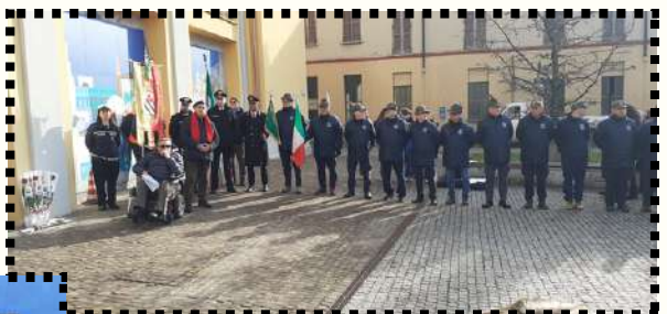
Un gruppo di Alpini di Meda e una rappresentazione dell'ANPI del Comune