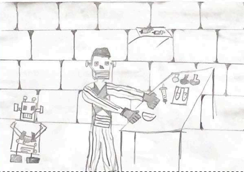
La robotica del futuro.

Un gruppo di scienziati del centro Atomium di Bruxelles ha annunciato che tra dieci anni il mondo cambierà in modo considerevole. Per quanto riguarda l'inquinamento globale, verranno emanate leggi molto rigorose che permetteranno di arrivare a ridurre i valori attuali di monossido di carbonio e altri agenti presenti nell'aria. Questo consentirà di ridurre la mortalità e migliorare la qualità di vita in tutto il Pianeta. Inoltre la robotica porterà notevoli scoperte a livello medico che miglioreranno la salute degli esseri umani e aiuteranno a curare molte malattie. I progressi scientifici riguarderanno anche la nutrizione, verranno integrate sempre più sostanze e fibre naturali che consentiranno di avere un benessere maggiore.