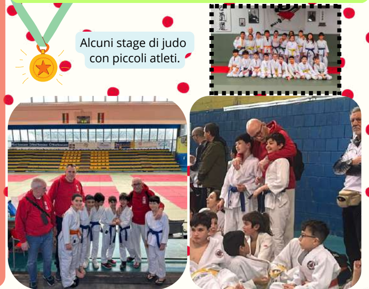
Alcuni stage di judo con piccoli atleti.