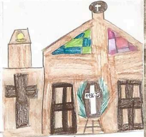
Funerale di Papa Francesco.

Si è concluso il 2025! Non è stato solo l'anno delle "follie" americane del presidente Trump, ma purtroppo sono scomparse molte persone importanti. Il nostro giornale ne vuole ricordare alcune. Il 21 aprile 2025 è morto papa Francesco, che ha guidato la Chiesa dal 2013 ed è stato una figura di riferimento per molti fedeli. La sua scomparsa ha colpito tutto il mondo ed il suo funerale è stato seguito in tutto il mondo. Nel corso del 2025 sono scomparse molte altre persone famose, lo stilista Giorgio Armani, il conduttore televisivo Pippo Baudo, la cantante Ornella Vanoni, il giornalista Emilio Fede, il fumettista Giorgio Forattini, l'attore americano Robert Redford, l'attrice Claudia Cardinale, le gemelle Kessler, l'attrice francese Brigitte Bardot e altri ancora. È stato un anno un po' triste e purtroppo il 2026 è iniziato in un modo molto drammatico a causa della tragedia svizzera di Crans Montana, in cui hanno perso la vita 40 persone, tra cui molti giovani ragazzi e ragazze.